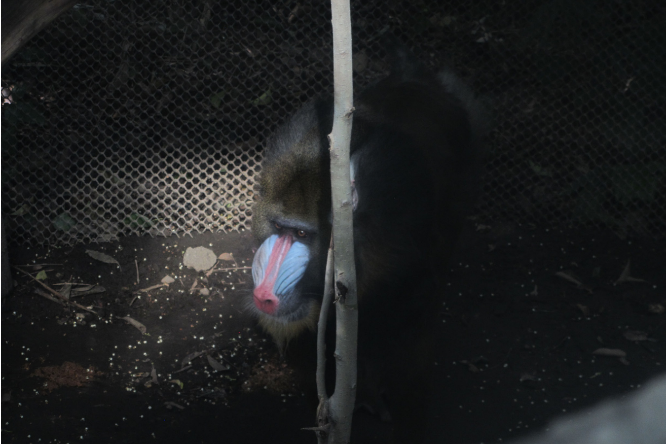
Figura 1. Una vida en cautiverio, 2017.